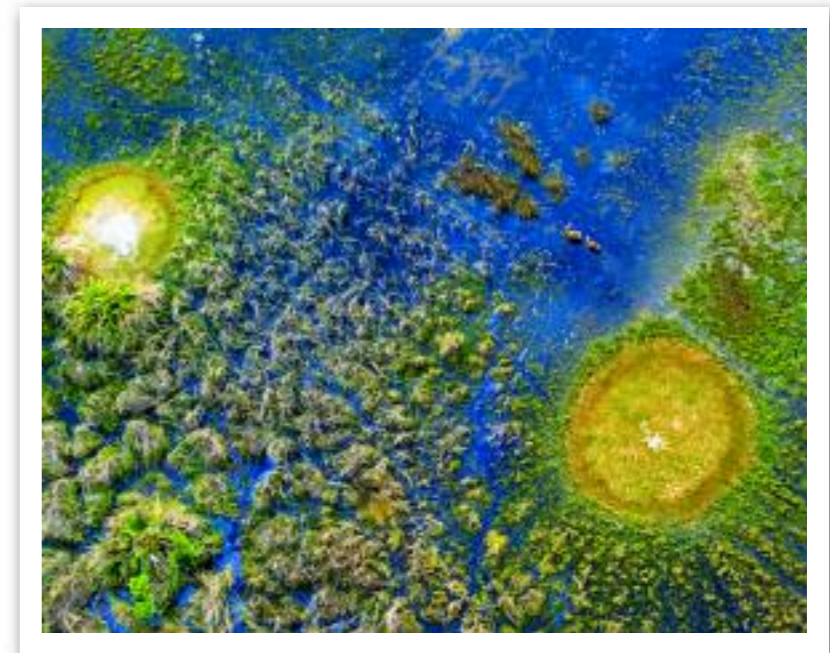
Red Lechwe, Okavango Delta, Botswana. Original Ditone-print, 40 x 50 cm / 15 3/4 x 19 5/8, limited edition of 300 copies, signed and numbered

"[Michael Poliza's]... AFRICA is unlikely to change the way you think about Africa. But it might change the way you think about photography."